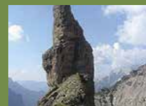
Dolomiti Friulane e d'Oltre Piave